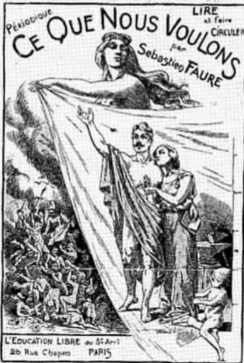
Nous reproduisons ci-dessus la couverture artistique de la brochure de propagande que vient d'écrire L'Éducation libre du 31-A-1, Paris. — On peut se la procurer au prix de 1 fr. le 100 (port en sus) — s'adresser au c. Davis, 30, rue Chapoy, Paris.

Il faut enfin que chaque semaine notre cloche tinte par delà les collines et les plaines; qu'elle tinte un glas de mort à la société bourgeoise et d'espoir aux découragés qu'elle sonne à toute volée le socin du combat.