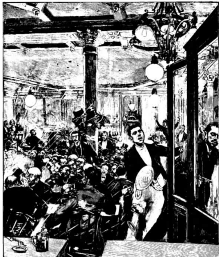
1. Bomaanslag op 12 februari 1894 door Emile Henry in café Terminus van het station St-Lazare te Parijs.

ADMINISTRATIF : Bruxelles, 23, rue Léopold Abonnés à Paris la ligne.