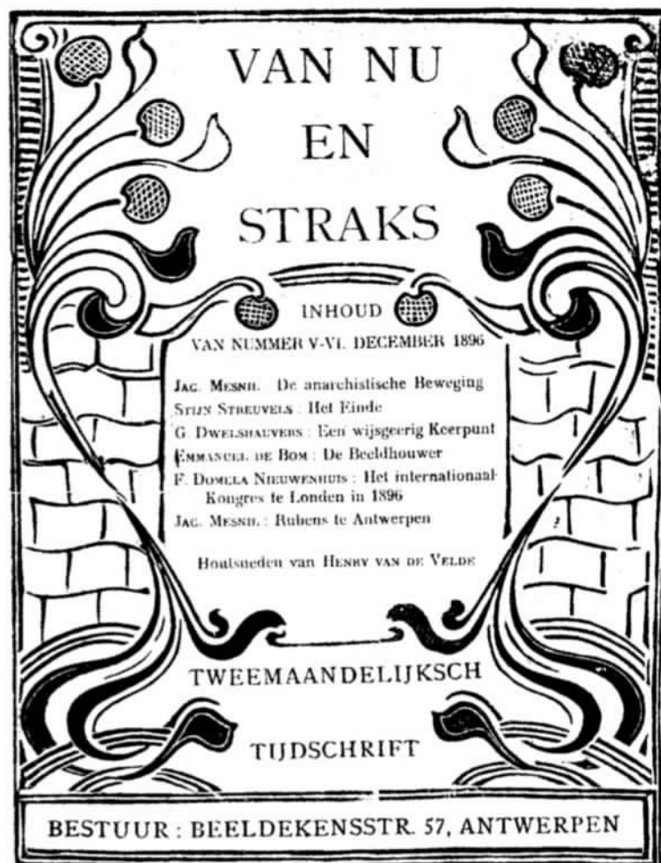
17. Van Nu en Straks , anarchizerende spreekbuis van de Vlaamse avant-garde.