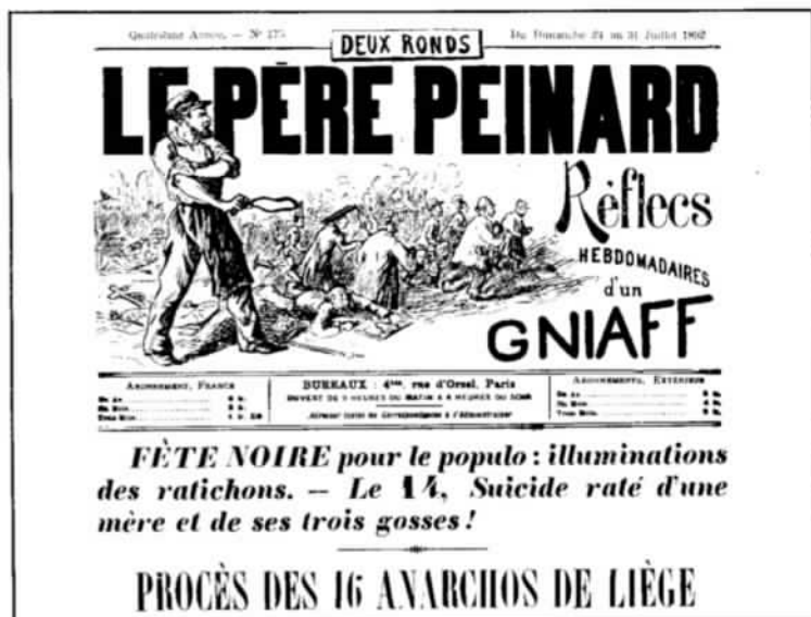
2. Le Père Peinard , 'populaire' Frans anarchistisch weekblad.