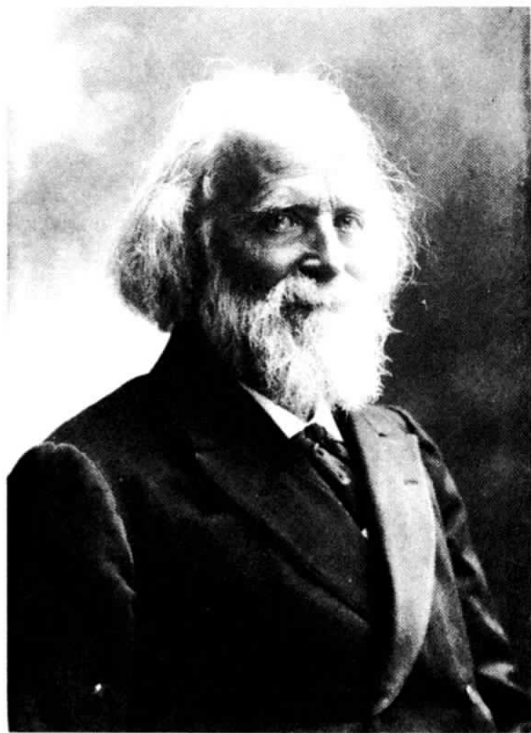
15. Elisée Reclus.