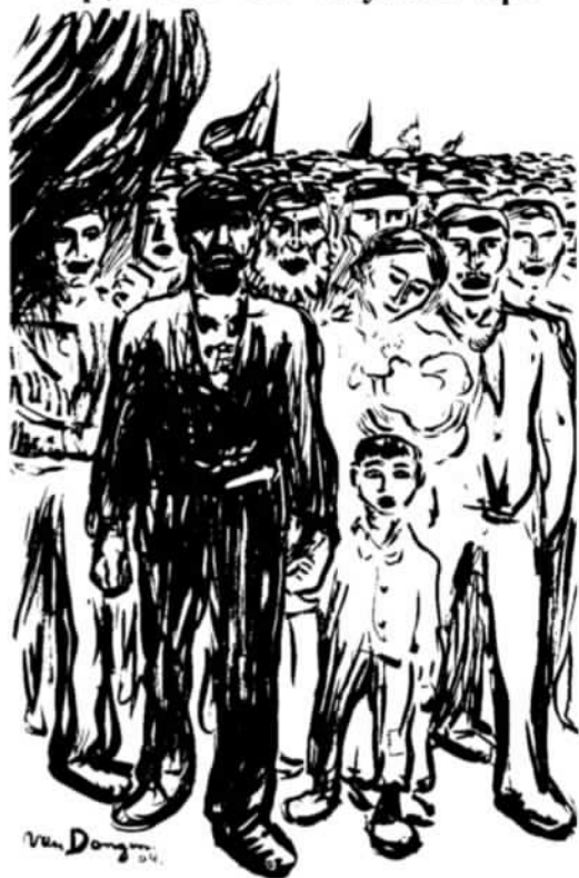
7. Feestnummer van De Vrije Socialist . 'Samengesteld ter herinnering aan de oprichting van Recht voor Allen , diene dit blad tot hulde aan Ferdinand Domela Nieuwenhuis, voor zijn arbeid in den dienst van het proletariaat ...'