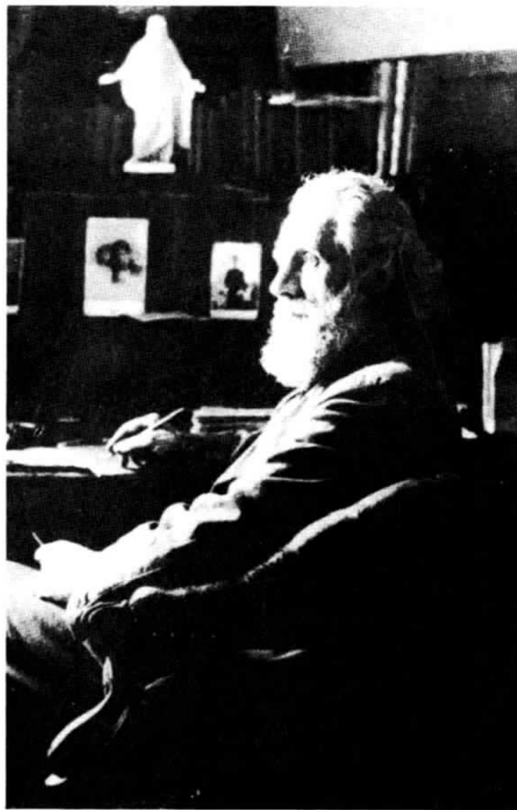
8. Ferdinand Domela Nieuwenhuis.