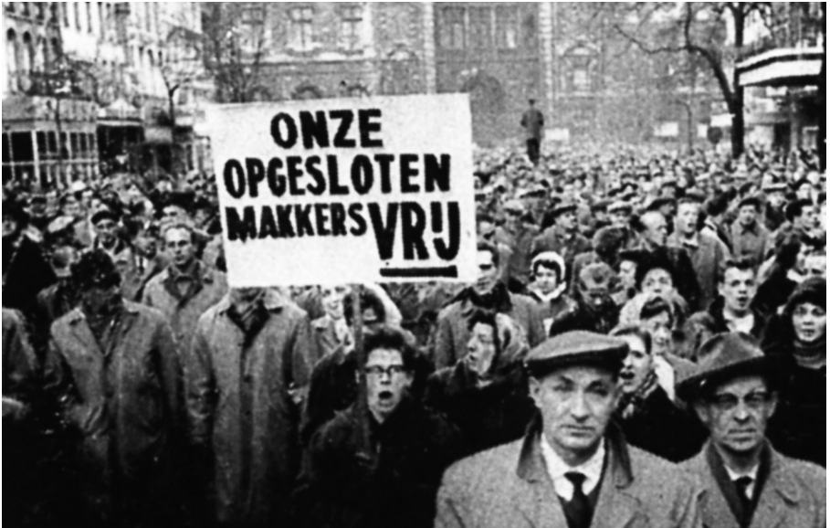
Antwerpen. De betogers eisen de vrijlating van de gevangen genomen stakers (ii)