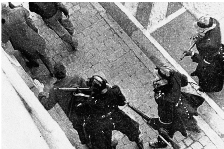
Brussel. Een slaande argumentatie (ii)