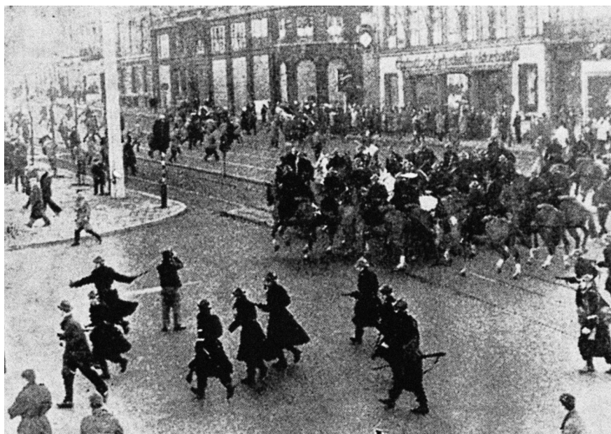
Brussel. Te paard of te voet, de rijkswachters chargeren op de betogers (ii)