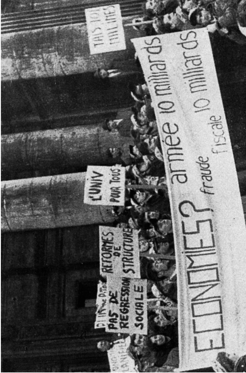
Brussel. De regering zoekt geld? De studenten maken duidelijk waar er geld te vinden is: bij het leger en de fiscale fraude. (ii)