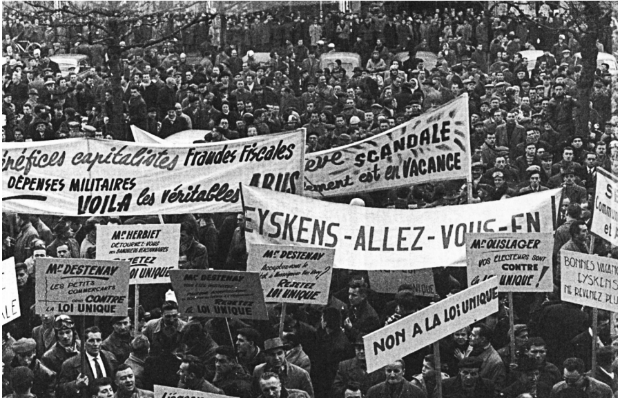
Protestbetoging in Luik aan de vooravond van Kerstmis 1960. De betogers van de openbare diensten halen ook uit naar het stadsbestuur. (iii)