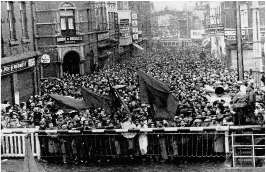
Seraing. Een typische arbeidersmeeting. (ii)