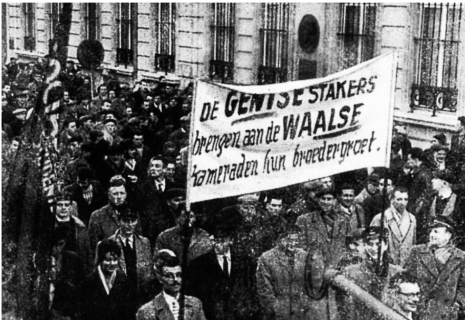
Gent. De solidariteit van de Vlaamse stakers met hun Waalse kameraden was erg groot (ii)