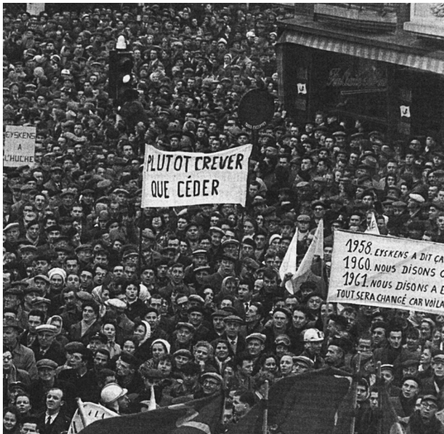
Betoging in La Louvière (iii)