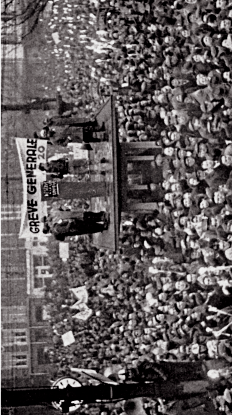
Luik op 14 december (ii)