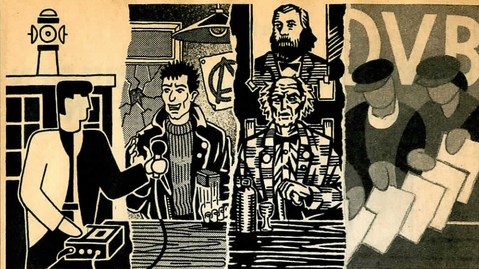
Tekening: René van Asselt

Achter de schuur ligt de tuin; een grote tuin met een composthoop. Want sinds 'n jaar of