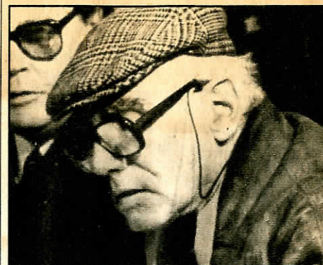
Luigi Comencini: Kiezen voor overwonnenen

Ik weet niet of het zo bijzonder is, maar in ieder geval wel functioneel. Ik zou er nog