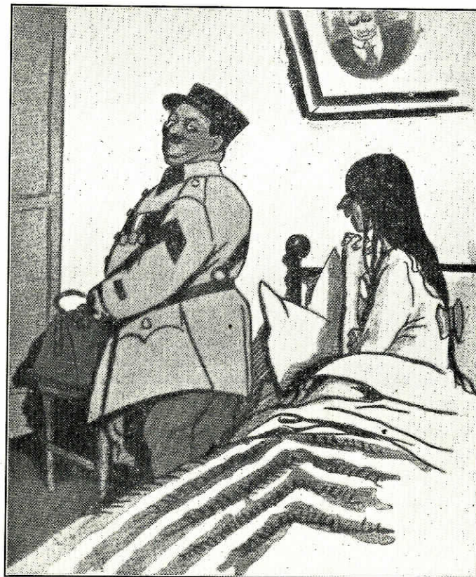
— Houd je uniform aan vannacht! Die staat je zoo goed...

gen, de conventie te breken, allerlei te doen en te durven, waaraan men vroeger zelfs niet waagde te denken. Of het soms niet aantrekkelijk was, over de hei met kanonnen te rijden, in je kosthuis goed behandeld te worden, met een troep kameraden avontuurlijk te leven en nu en dan een romannetje te hebben, dan als onderdeel van een machine op een of andere duistere fabriek te worden uitgebuit, en thuis te vergaan van het eindeloos gezanik en de zorgen. Of de „mobilisatie” bovendien juist niet de wildste in-