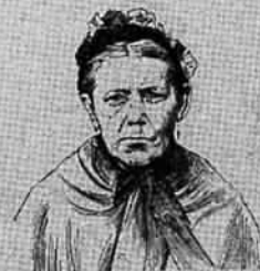
La Femme Schlebach