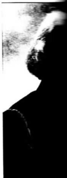
De kentering van Elisée Reclus naar voor het de beweging anarchist

In ieder geval geruige daarvoor lige anarchisme in eenvolgens, al die tellectueel waz ari schreef het bl