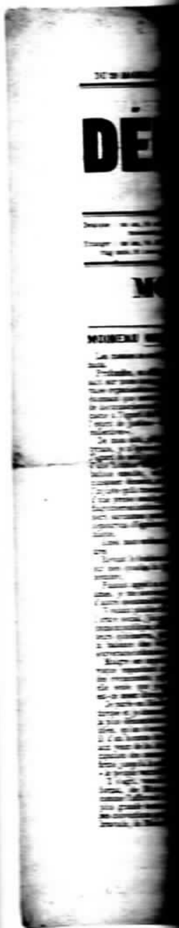
Ein gewone... anarchistische pers... maandblad

Met het verdwijnen van La Vérité hadden de Franstalige anarchisten in