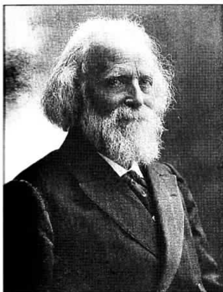
De komst van Elisée Reclus zorgde niet voor het boegbeeld waaraan de beweging duidelijk nood had.

In ieder geval hield Le Libéraire de zaak-Reclus spoedig voor bekeken, getuige daarvan een aantal oprispingen die als zeer klassiek voor het toenmalige anarchisme in België beschouwd mogen worden. Zo moesten het achter-eenvolgens, al dan niet terecht, ontgelden: de burgers, of ze nu student of intellectueel waren of niet, de politici, maar bovenal de socialisten. Op 28 januari schreef het blad, dat de studenten "sympathiques aux idées libertaires et anarchistes ... se sont heurtés à deux difficultés. La première c'est que ... fils de repus, les étudiants, ont agi comme des bourgeois ... ces petits messieurs se sont dérobés lorsqu'il s'est agi de prendre une attitude réellement virile vis-à-vis de la crapule qui siège au Conseil d'administration de l'Université! ... De plus, la crise était destinée à avorter du jour où les étudiants, cessant d'agir et de parler par eux-mêmes se sont mis sous le patronage de politiciens véreux comme Janson ou Vandervelde!"