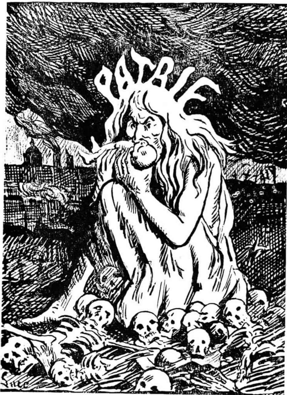
De burgerij had haar vaderland waar het kapitaal het meest opbracht.

oor zijn artikel gd. Door het n rechtstreeks en. Wel vroeg hts een lichte en die inmid- s de Brouckè-