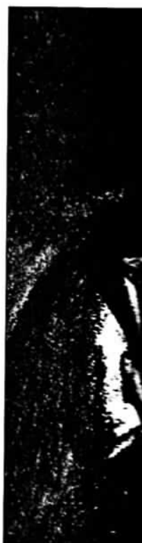
In 1912 verongeluc mijn. Een moeter wellicht niet kwamen

stand van vervol recte tijdelijk na hand, aldus het "verdachten" bij veilleerd. De nam