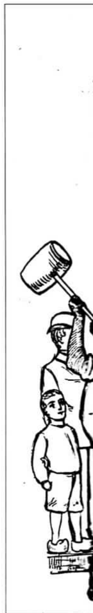
De revolutionaire Overigens was aan vakbondsactie moe

Voor de Antwerpse diamantbewerkers was een vakverbond met kleinere, meer revolutionair-syndicalistische organisaties niet meer interessant 94 . In de BWP besepte men dat om de revolutionaire syndicalisten te isoleren er een einde moest worden gemaakt aan de verdeeldheid die te Antwerpen heerste. Het zou wel nog tot begin 1910 aanslepen voor de door de diamantbewerkers beheerste Federatie van Vakbonden en het bij de BWP aanleunende Algemeen Arbeidssecretariaat met elkaar verzoend raakten 95 . L'Action directe , het blad van de revolutionaire syndicalisten, zou 1908 niet overleven. Sinds het feitelijk opheffen van de CGT werd het blad niet meer officieel gedragen door een organisatie. Tegelijk had Fuss gezien de ernstige gerechtelijke perikelen in